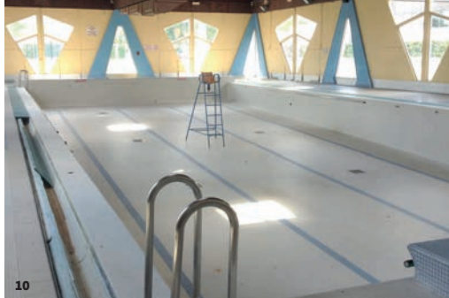
10. L'ancienne piscine de Malbentre